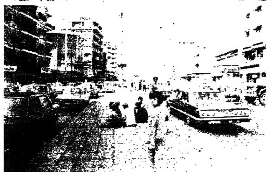
■ حركة سير ونشاط اعتيادي في كورنيش المزرعة ■